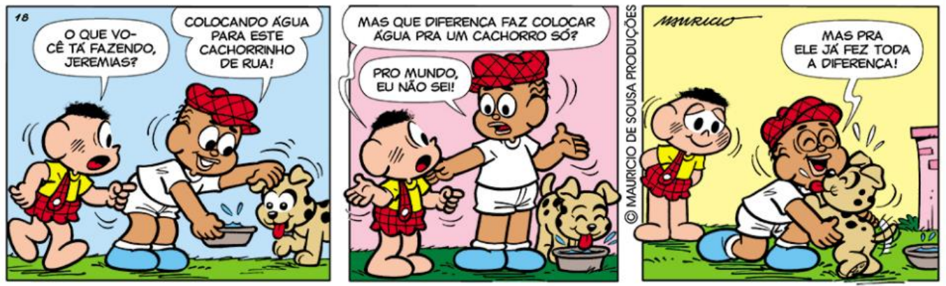
Figure 1 https://desmanipulador.blogspot.com/2017/04/tirinhas-turma-da-monica.html